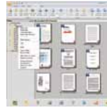
Pantalla principal PaperPort SE14

- La elección profesional para organizar y compartir sus documentos