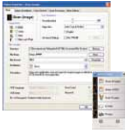
Pantalla principal de Button Manager V2

-Completa tu digitalización en un solo paso