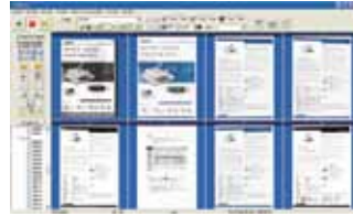
Pantalla principal de AVScan X

-La herramienta inteligente de gestión documental